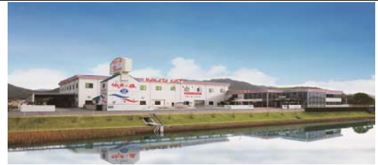
大三島工場（愛媛県今治市大三島町）