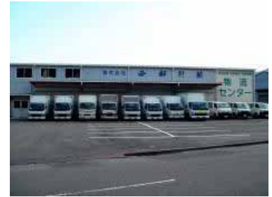
本社物流センター(宇和島市)